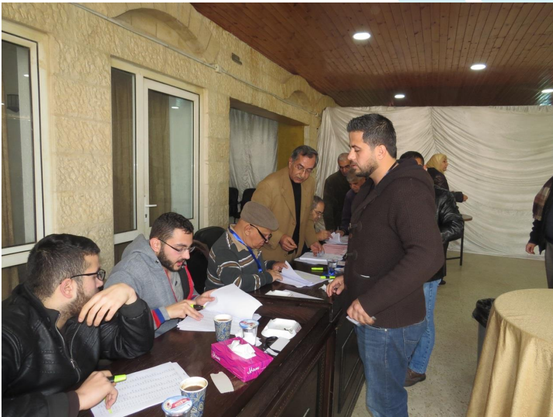
انتخابات مجلس الفرع والهيئة المركزيه 2018/2/16