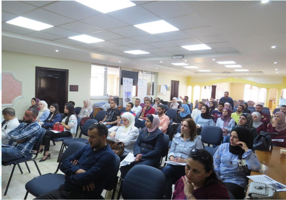
ورشة عمل ادارة المشاريع 2018/8/15