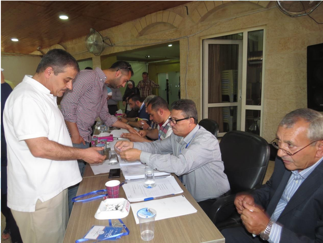
انتخابات مجلس النقابة 2018/5/4