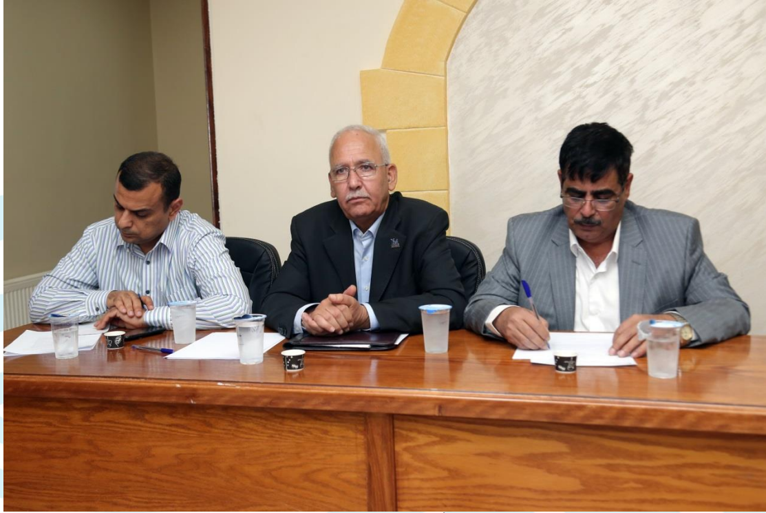
لقاء مهندسي المساحة مع النقيب في الفرع 2018/7/7