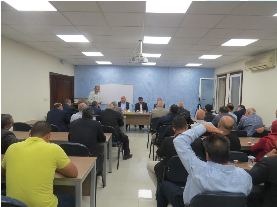
ندوة حوارية مشروع تعديلات قانون ضريبة الدخل 2018/10/2