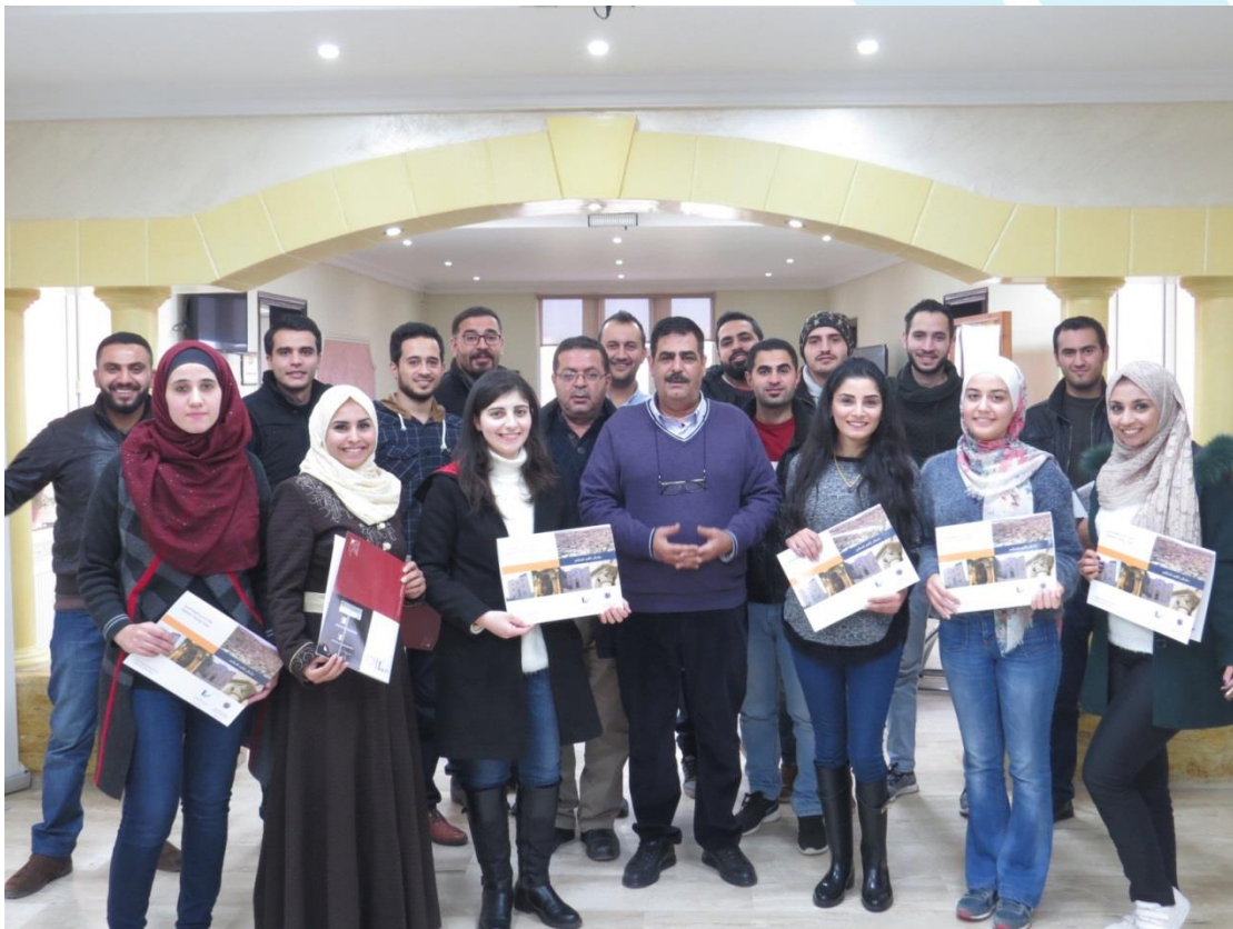
دورة ريفيت مدني 2018/11/25