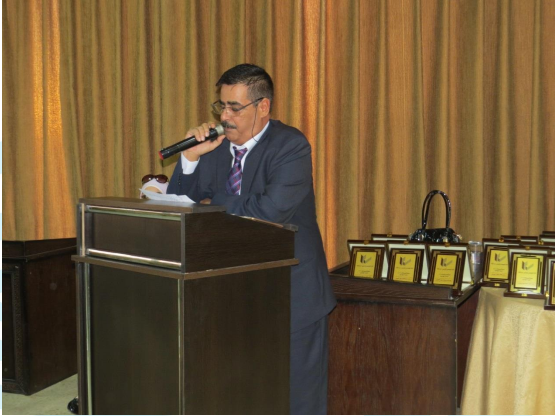
حفل تكريم ابناء المهندسين/ات الناجحين بالثانوية العامة 2018/9/24