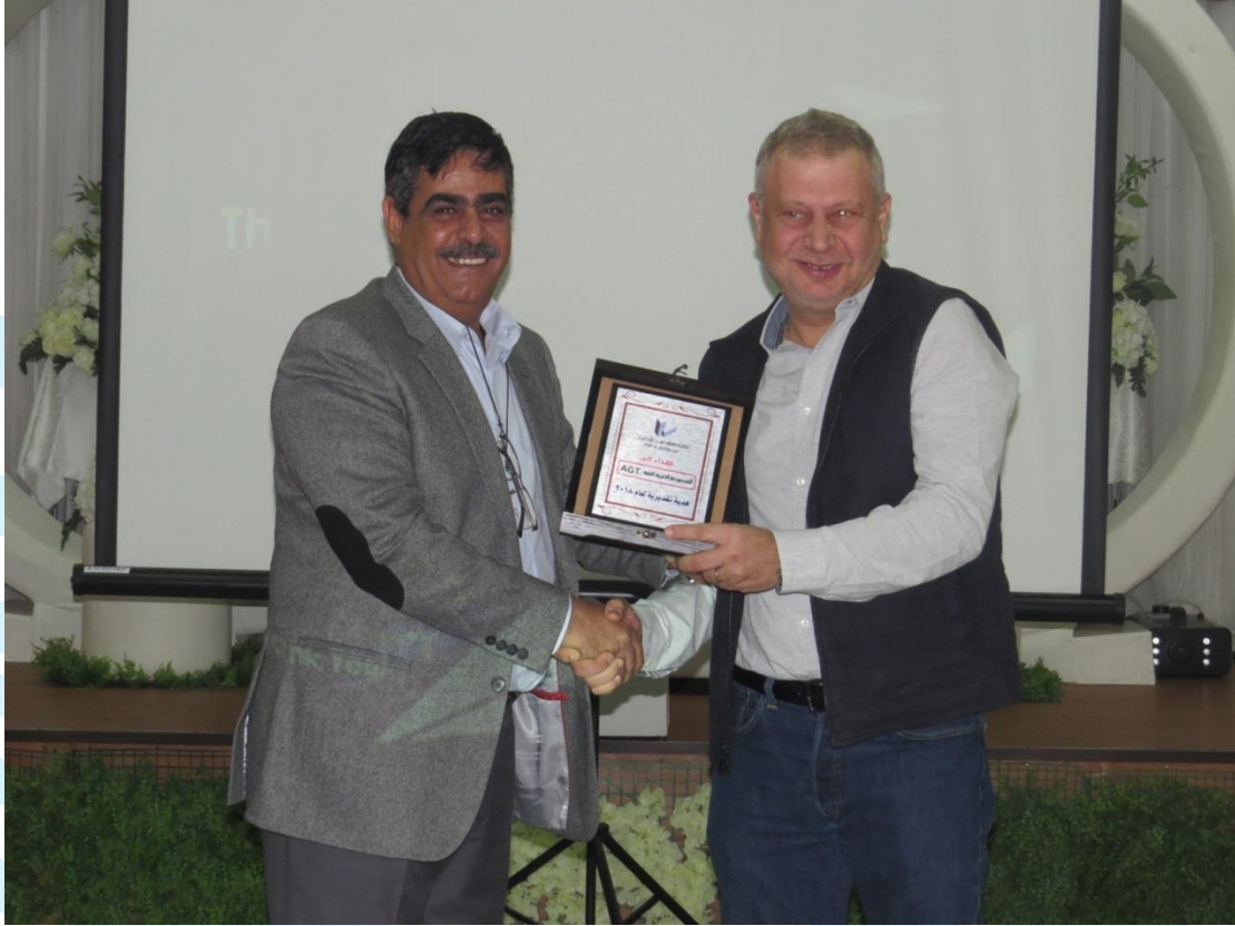
ورشة عمل أنظمة الطاقة المتجدده 2018/12/15