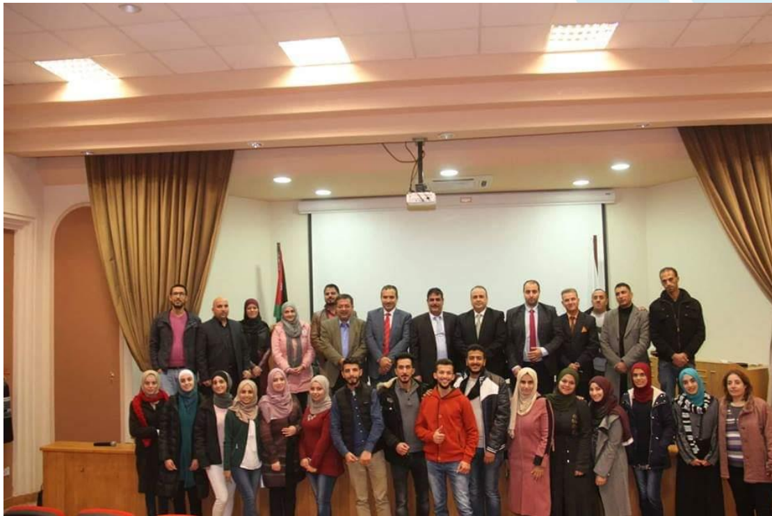
نشاط هندس مهنتك-جامعة البلقاء التطبيقية 2018/12/9