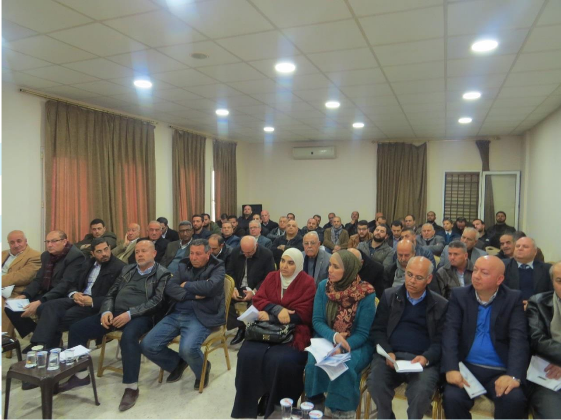
اجتماع الهيئة العامة 2018/2/15