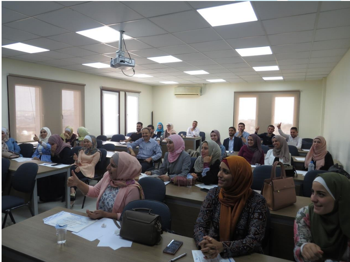
ورشة عمل ادارة العقود حسب فيديك 2018/7/28