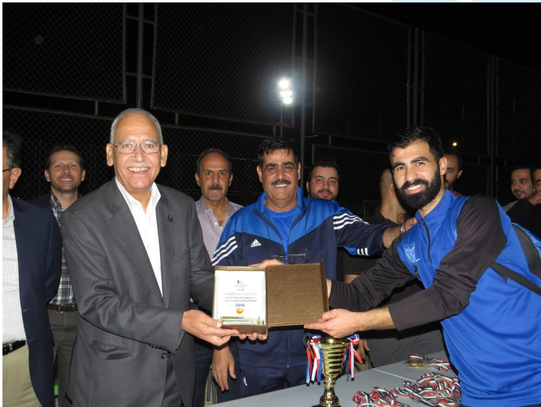
اختتام وتتويج البطولة الكروية لعام 2018 2018/6/13