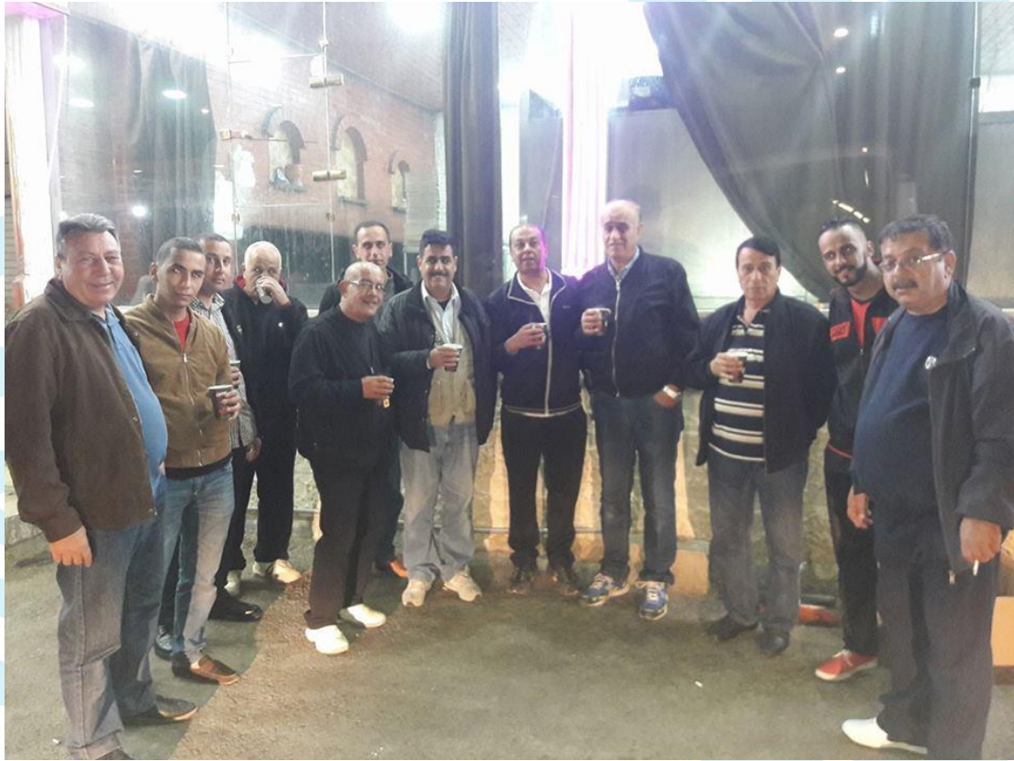
رحلة الى طابا المصرية 2018/4/26